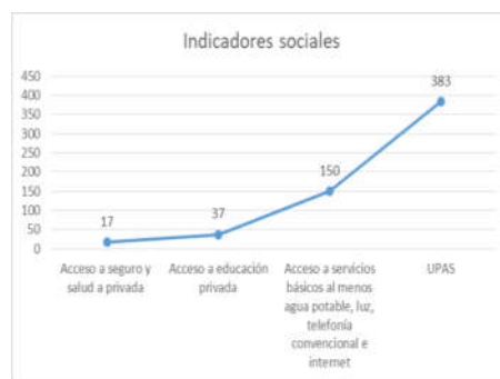
Figura 3. Indicadores sociales de la Parroquia Imantag.

acceso a educación privada, y el 40% tienen acceso a servicios básicos. Lo que significa que la inversión realizada en salud y educación con relación al 85% de agricultores que proyectan invertir en la producción de sus tierras (tabla 4), es muy baja.