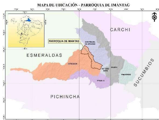
Figura 1. Ubicación de la Parroquia Imantag.

La presente investigación se realizó en la parroquia de Imantag, compuesta por 9 comunidades, perteneciente al Cantón Cotacachi.